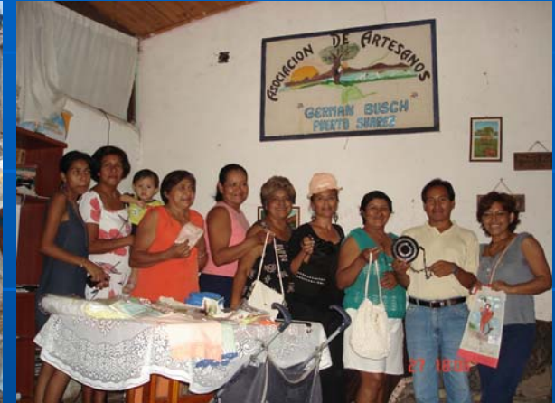
Asociación Artesanas Germán Busch