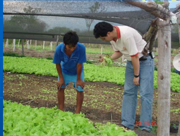
Asistencia técnica Asoc. Horticultores