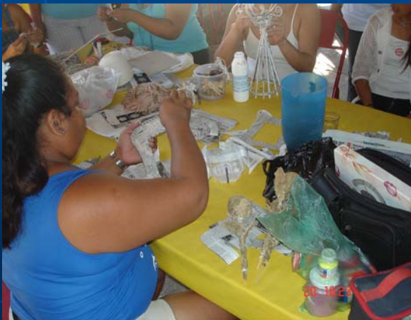
Curso Vocacional Artesanía – Comité Femenino Cooperativa de Pescadore