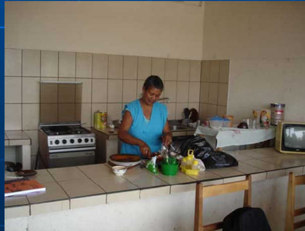
Apoyo a Vivanderas del Paradero