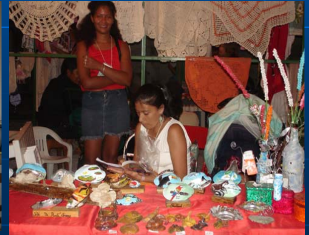
Artesanas – Fexpo Pantanal 2005