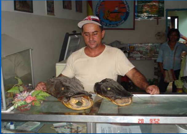
Frial Cooperativa de Pescadores